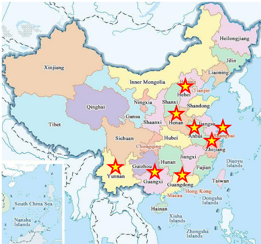
ภาพที่ 2 แสดงภูมิภาคสำคัญของชาวจีนในภาคอีสาน (สัญลักษณ์ดาวสีเหลือง)

3.3.2 เพศและสถานภาพสมรส ชาวจีนอพยพใหม่ในภาคอีสานส่วนใหญ่เป็นเพศชาย ในจำนวนผู้ให้ข้อมูลทั้งหมด 17 คน เป็นเพศชาย 14 คน ทั้ง 14 คนนี้แต่งงานแล้ว โดยจำนวนหกคนแต่งงานกับผู้หญิงไทย ส่วนอีกแปดคนแต่งงานกับผู้หญิงจีน ส่วนใหญ่ภรรยาจะอยู่ที่ประเทศจีนและเดินทางมาเยี่ยมสามีเป็นครั้งคราว มีเพียงส่วนน้อยของผู้ให้ข้อมูลเท่านั้นที่อพยพมาตั้งถิ่นฐานในไทยทั้งครอบครัว ในจำนวนผู้ให้ข้อมูลทั้งหมด 17 คน มีเพียงสามคนเท่านั้นที่เป็นเพศหญิง