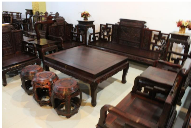
ภาพลักษณะเฟอร์นิเจอร์แบบจีนที่ผลิตจากโรงงานชาวจีนในจังหวัดอุดรธานี (ภาพประกอบจากอินเทอร์เน็ต)

ชาวจีนอพยพอีกรายในขอนแก่นให้ข้อมูลแก่ผู้วิจัยว่า ตนเองนั้นทำธุรกิจแปรรูปอาหาร มีโรงงานอยู่ในขอนแก่นและขยายกิจการไปตั้งโรงงานที่สองอยู่ที่สมุทรสาคร และกำลังสร้างโรงงานที่สามอยู่ในสมุทรสาคร เช่นเดียวกัน โดยโรงงานที่ขอนแก่นนั้นจ้างลูกจ้างเป็นคนไทยทั้งหมด แต่โรงงานที่สมุทรสาครลูกจ้างเกือบทั้งหมดเป็นชาวเมียนมา มีเพียงฝ่ายบัญชีและผู้ช่วยของตนเท่านั้นที่เป็นคนไทย เนื่องจากโรงงานที่สมุทรสาครมีวัตถุดิบในการผลิตที่มีกลิ่นเหม็นคาวรุนแรง มีแต่ลูกจ้างชาวเมียนมาเท่านั้นที่ทนกลิ่นและลุยงานได้