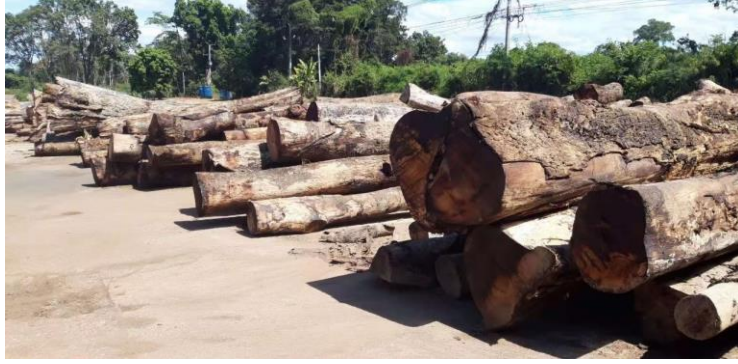
ภาพไม้พะยุงและไม้ประดู่สำหรับรอทำเฟอร์นิเจอร์ส่งกลับไปขายที่จีน