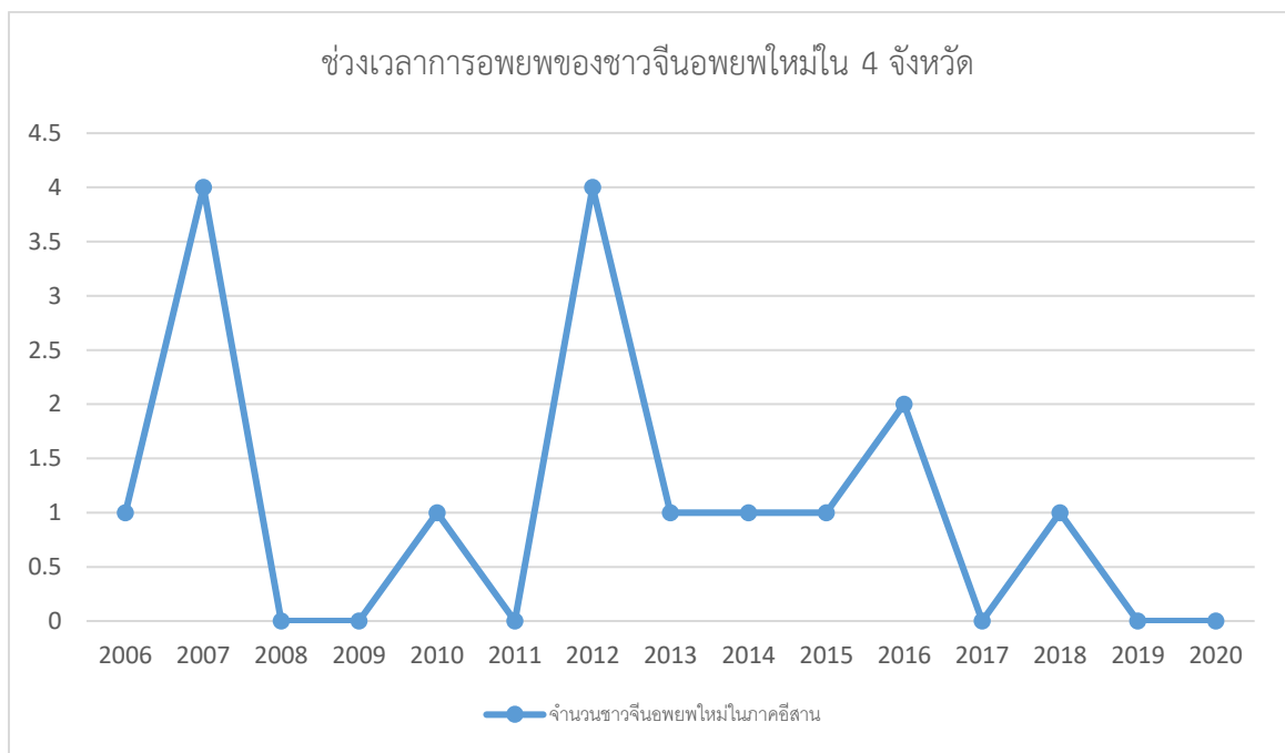
ภาพที่ 3 แสดงช่วงเวลาการอพยพของชาวจีนอพยพใหม่ใน 4 จังหวัด (รายปี)

จากการศึกษาพบว่า การอพยพของชาวจีนอพยพใหม่ในภาคอีสานมีลักษณะการอพยพแบบทยอยย้ายถิ่น ไม่ได้อพยพมาเป็นกลุ่มก้อนหรือทะลักเข้ามาในช่วงเวลาใดเวลาหนึ่ง ซึ่งการอพยพเข้ามาของชาวจีนอพยพใหม่ในภาคอีสานปรากฏมากหลังจากจีนเข้าร่วมเป็นสมาชิกองค์การการค้าโลก (WTO) แล้วเป็นระยะเวลาหนึ่ง ซึ่งเป็นช่วงที่เศรษฐกิจจีนกำลังเติบโตและจีนมีนโยบายสนับสนุนให้ชาวจีนออกไปลงทุนยังต่างประเทศ อีกทั้งยังเป็นช่วงที่จีนและประเทศในอาเซียนได้มีการลงนามความร่วมมือหลายอย่าง เช่น ข้อริเริ่มหนึ่งแถบหนึ่งเส้นทาง (BRI) กรอบความร่วมมือล้านช้าง-แม่โขง (LMC) เป็นต้น ทำให้เกิดการไปมาหาสู่กันและดึงดูดให้ชาวจีนออกมาทำการค้าการลงทุนในอาเซียน รวมถึงภาคอีสานของไทยมากขึ้น